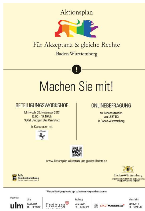
Abbildung 2: Plakat Beteiligungsworkshop

Insgesamt nahmen an den jeweils vierstündigen Beteiligungsworkshops über 600 Personen aus Landes- und Kommunalverwaltungen, Politik und der LSBTTIQ-Community, interessierten Bürger_innen sowie weitere gesellschaftliche Akteur_innen teil. Der Ablauf der Veranstaltungen verlief an allen Standorten analog. Zu Beginn gab es Impulsvorträge von Vertretungen der Landesregierung, dem jeweiligen Oberbürgermeister oder Bürgermeister und dem Netzwerk LSBTTIQ Baden-Württemberg sowie in Mannheim dem Rektor der